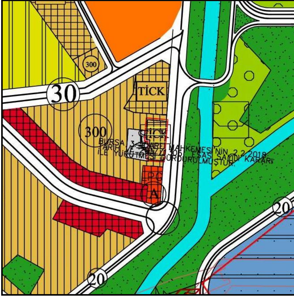
Yürürlükteki 1/5000 Ölçekli Osmangazi Nazım İmar Planı Örneği