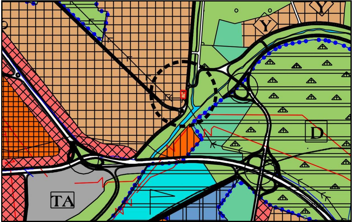
Yürürlükteki Bursa Büyükşehir Belediyesi Merkez Planlama Bölgesi 1/25000 Ölçekli Nazım İmar Planı Revizyonu